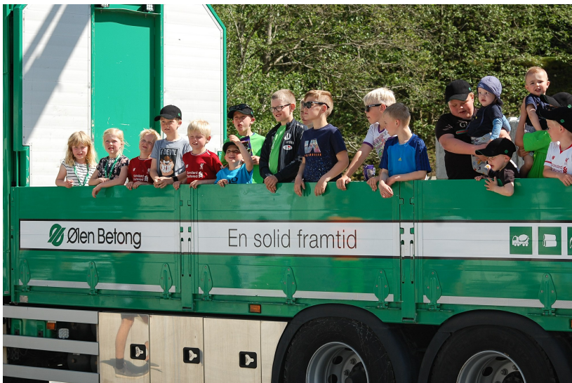
Med god hjelp fra samarbeidspartnere Helgevold Elektro og Mapei ble det stinn brakke hos Ølen Betong i Suldal, 7.juni.